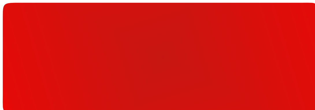
Czerwony / BG 3020